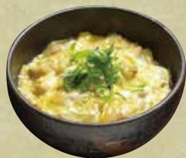
国産朝挽き鶏の親子丼 900円(税込972円)