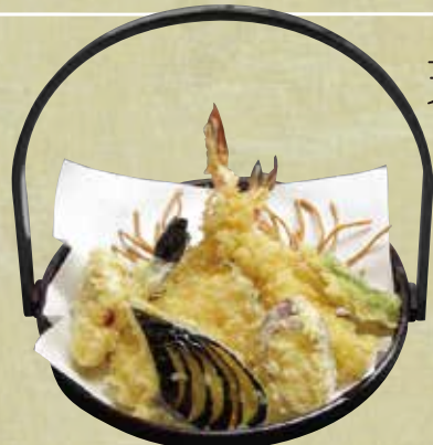
天ぷら盛り合わせ 1,380円 (税込1,490円)