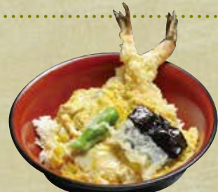
天とじ丼 1,130円(税込1,220円)