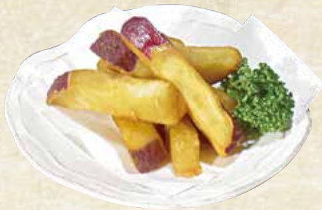
おさつスティック 400円(税込440円)