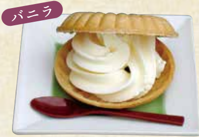
ソフトモナカ 各400円(税込440円)