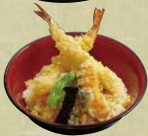
天丼 1,130円 (税込1,220円)