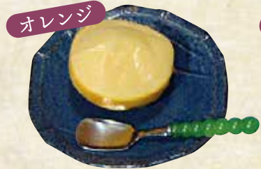
シャーベット 各400円(税込440円)