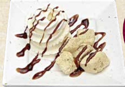
わらび餅と ソフトアイスの黒蜜かけ 530円(税込583円)