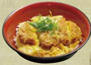
カツ丼 1,080円 (税込1,166円)