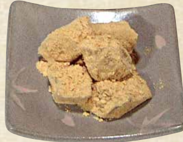
わらび餅 400円 (税込440円)