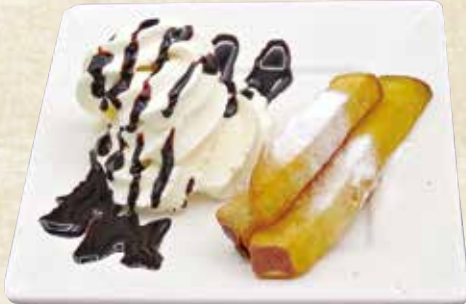
おさつスティックと ソフトアイスの チョコレートソースかけ 530円(税込583円)